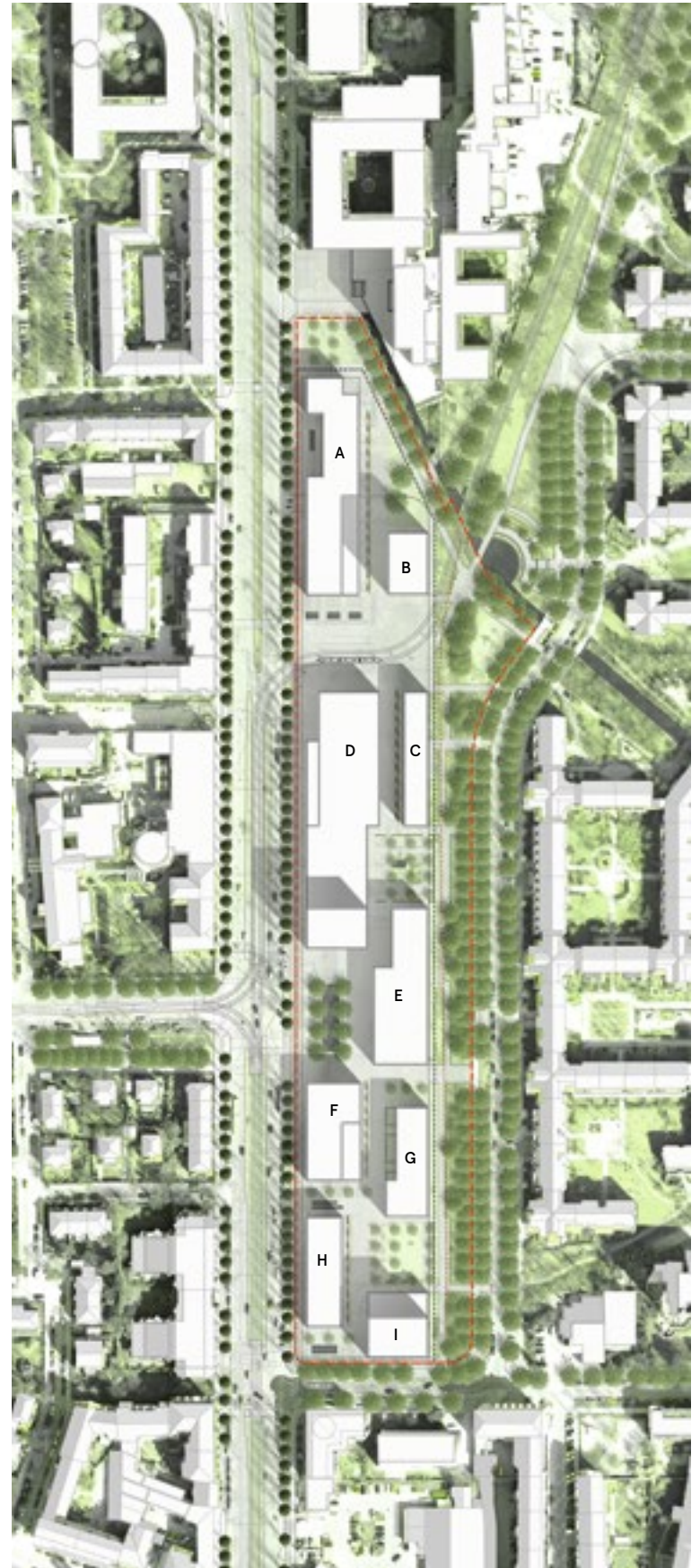
Auf dem schmalen Grundstück profitieren alle Bauten von der städtischen Adresse im Westen wie vom Grünraum im Osten.