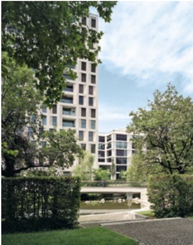
Der nördliche Bauabschnitt ist seit 2016 fertig. Die grüne Umgebung am freigelegten Bachlauf und der eindrucksvolle Baumbestand an der Berliner Strasse zur Ostseite prägen das Bild.